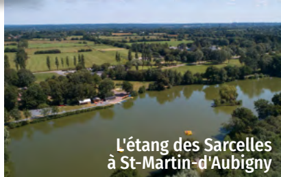
L'étang des Sarcelles à St-Martin-d'Aubigny