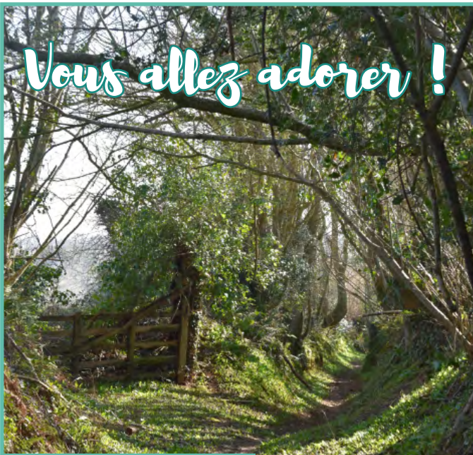
La balade dans les chemins creux