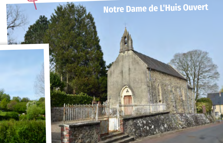
Notre Dame de L'Huis Ouvert