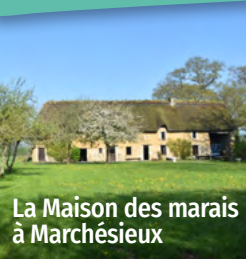
La Maison des marais à Marchésieux