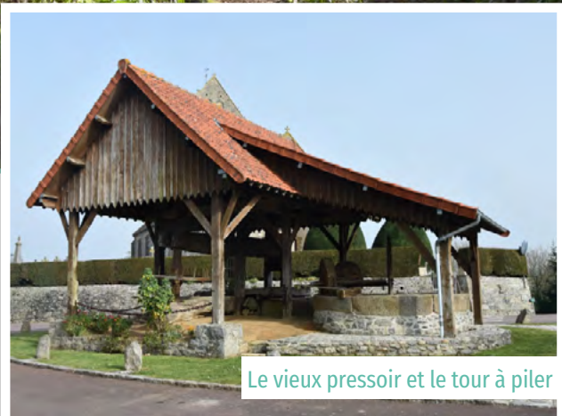
Le vieux pressoir et le tour à piler