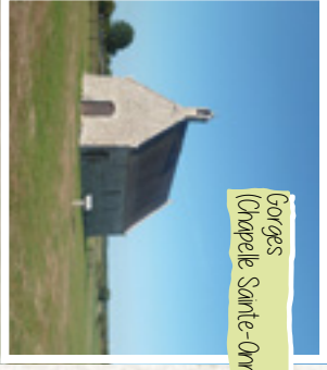
Gorges (Chapelle Sainte-Anne)