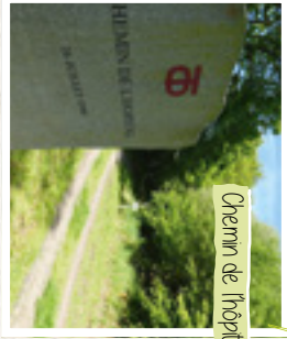
Chemin de l'hôpital