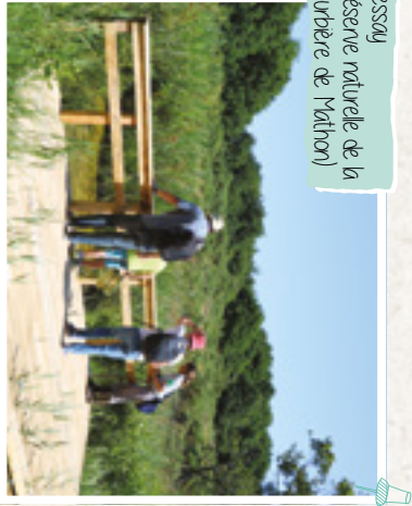
Lessay (Réserve naturelle de la tourbière de Mathon)

Puis d'information dans la Carte vélo disponible dans les lieux d'informations habituels ou sur www.cocm.fr et www.tourisme-cocm.fr