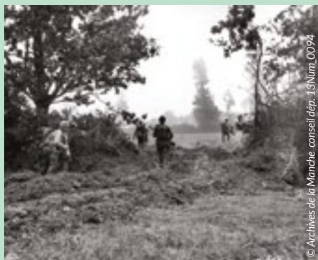
© Archives de la Manche conseil dép. 13Nim_0094

Maison des Loisirs et de la Découverte 02 33 45 14 34 - tourisme@cocm.fr www.tourisme-cocm.fr