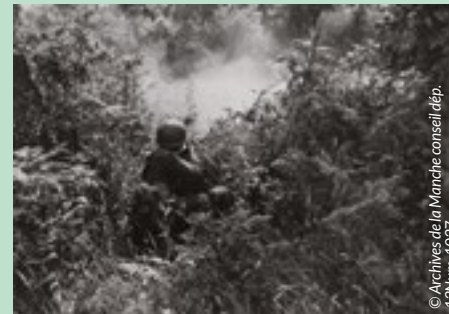
© Archives de la Manche conseil dépt. 13Num_1027

Lieu : Centre Culturel Route de Coutances - LESSAY Organisateur : Maison des Loisirs et de la Découverte 02 33 45 14 34 - tourisme@cocm.fr www.tourisme-cocm.fr